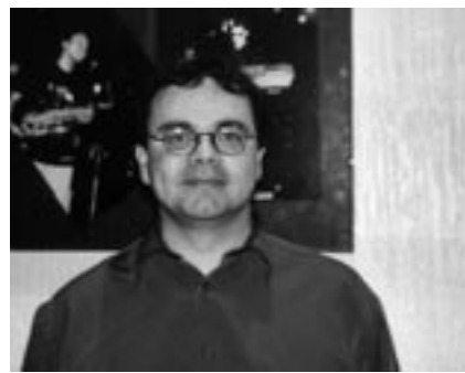
Une forte implication au service des jeunes et des entreprises. www.issy.com/clavim

À l'Espace Jeunes, structure d'insertion sociale et professionnelle, on accueille tout au long de l'année des jeunes de 18 à 25 ans afin de les accompagner dans leur démarche de formation professionnelle et de recherche d'emploi. Chaque année, six cents jeunes sont suivis dans le domaine emploi-formation pour être orientés dans le