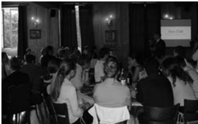
Boss Club, le nouveau nom présenté lors du dernier dîner estival.

« Boss Club, entreprendre à Issy », un nouveau nom qui se veut rassembleur et valorisant pour chacun des membres. En forme de clin d'œil : Boss, pour le chef d'entreprise mais aussi, pour un homme ou une femme responsable qui travaille sans compter ( bosses ), c'est le point commun des membres. Club pour son côté so british ..., à connotation forte du bon moment et de la convivialité. Le Club entame sa deuxième décennie, il fallait lui redonner une nouvelle impulsion : « Je crois que ce nom, tout en restant fidèle à ce que le Club a toujours été et à l'éthique de ses adhérents, sera régénérateur d'une dynamique , précise le président. Notre volonté est que chaque membre soit responsable de sa vitalité. Nous sommes à l'écoute des attentes, des idées et des remarques de chacun car la richesse du Club se fonde sur la rencontre et l'échange. » Boss Club sera présenté aux votes de l'assemblée générale de janvier prochain. Cette dernière édition 2002 du bulletin est l'occasion pour notre président de présenter ses vœux : « À l'aube de cette nouvelle année, je souhaite courage, détermination et conviction à tous les membres du Club. Et puisque c'est la voie que nous avons choisie, bonne bagarre à tous... » ■