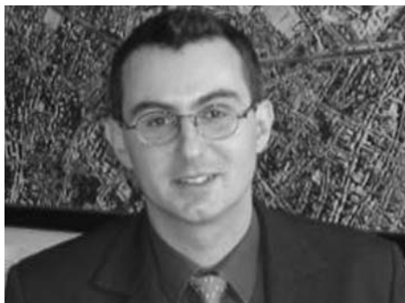
La direction de l'Action économique, le maillon fort de la politique « entreprises » de la Ville.

Confronter ses idées, échanger ses expériences, s'informer dans une ambiance empreinte de convivialité participent à la fidélisation de ses membres. ■