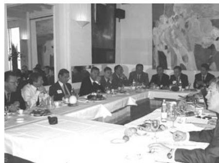
Au centre des débats électoraux, nos retraites sont sur la sellette.

Le 26 mars dernier, une vingtaine de chefs d'entreprise membres du Club, soucieux de leur avenir ont assisté au petit déjeuner « Rémunérations directes – rémunérations