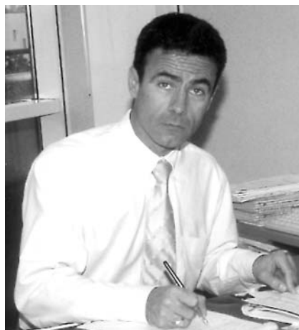
Création, transmission, croissance... Toutes les étapes de la vie des entreprises, accompagnées par la BDPME. www.bdpme.fr

En 1997, en rapprochant le CEPME (Crédit d'équipement aux PME) et la Sofaris (Société française pour l'assurance du capital risque des PME) pour créer la BDPME (Banque de développement des PME), les pouvoirs publics se dotaient d'un outil spécifique pour remplir une mission d'intérêt général au service des PME et TPE.