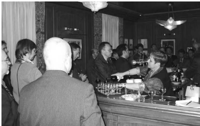
Le Bistrot du Club, un moment empreint de convivialité.

VUE D'ISSY est un bulletin interne trimestriel. Il est adressé gratuitement à tous les adhérents à jour de leur cotisation. Ils peuvent en obtenir plusieurs exemplaires sur simple demande adressée au secrétariat du Club à la Direction de l'Action Économique de la Ville. Bulletin du Club PME-PMI d'Issy-les-Moulineaux , 47, rue du Général-Leclerc, 92130 Issy-les-Moulineaux. e-mail : clubpmepmi@ville-issy.fr Directeur de la publication : Bertrand Cadoret. Conception graphique, rédaction et réalisation : Sacrés Caractères, membre du Club. Ont collaboré à la rédaction de ce numéro : Vincent Canu, Brigitte Pérard. Dépôt légal : juin 2002.