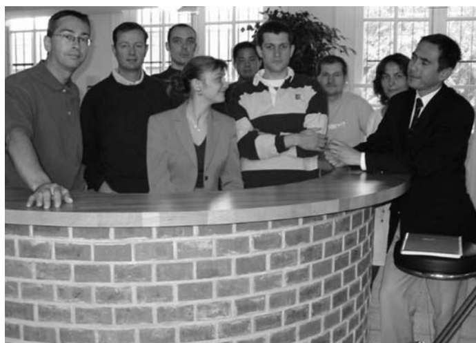
Cyberpépinière et pépinière isséennes accueillent de jeunes entrepreneurs en forte demande d'information et d'intégration.

1. Société d'économie mixte d'aménagement et de rénovation de la ville d'Issy-les-Moulineaux.