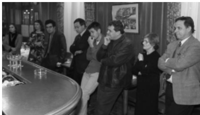
Les mardis conviviaux du Bistrot du Club.